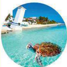
Tortue, Puerto Morelos (p. 104)